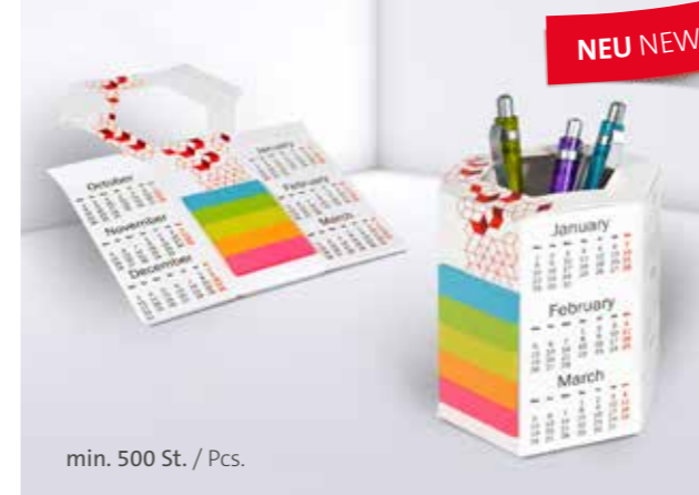
Office Organizer 06 Office organizer 06

Tidy and within easy reach: our cardboard note box is available in a range of shapes and sizes, printed as required, and totally customisable. Whether you want a standard shape or unusual shape – the advertising classic works.