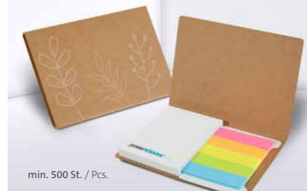
PURE notes Haftset 01 mit Papiermarker PURE notes adhesive set 01 with paper marker set

Unterstrichenes Maß = Haftseite Underlined dimension = Adhesive side