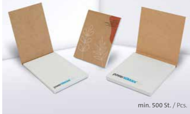
PURE notes Haftnotizen im Kartonumschlag PURE notes adhesive notes with cardboard cover