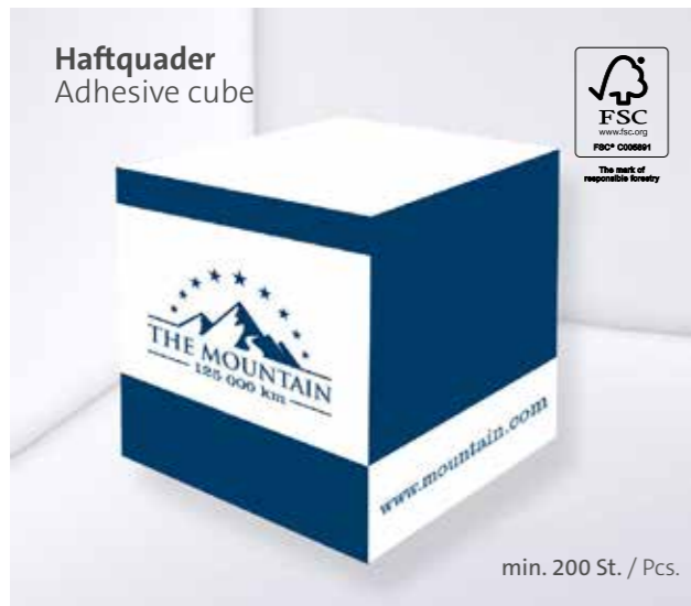
Haftquader Adhesive cube