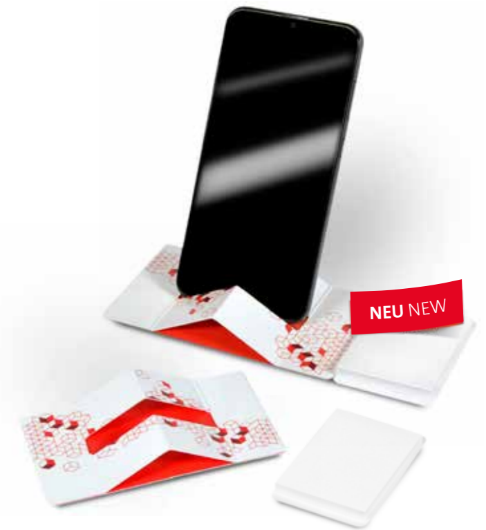
Haftset 27 mit Smartphonehalter Adhesive set 27 with Smartphone holder