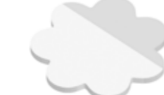
Blume Flower , 65 x 65 mm