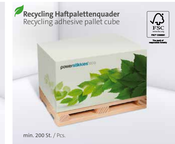
Recycling Haftpalettenquader Recycling adhesive pallet cube

*Zzgl. Holzpalette (ca. 15 mm)/ plus wooden pallet (approx. 15 mm)