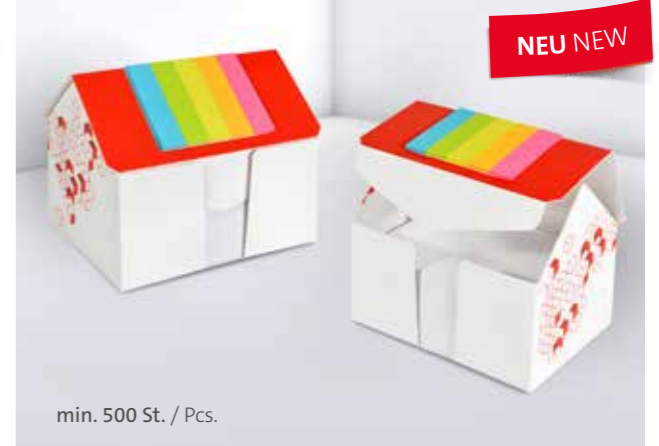
Kartonbox 10 Haus Cardboard box 10 House