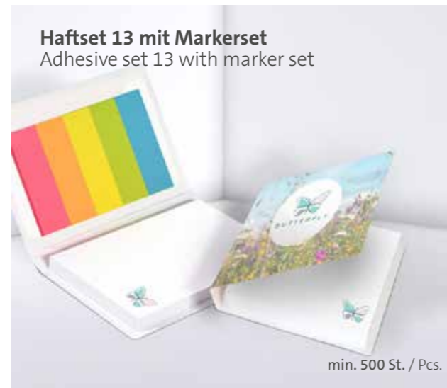
Haftset 13 mit Marker set Adhesive set 13 with marker set

Ohne Kugelschreiber, optional mit gestelltem Kugelschreiber erhältlich Without ballpoint pen, optionally available with a posed ballpoint pen