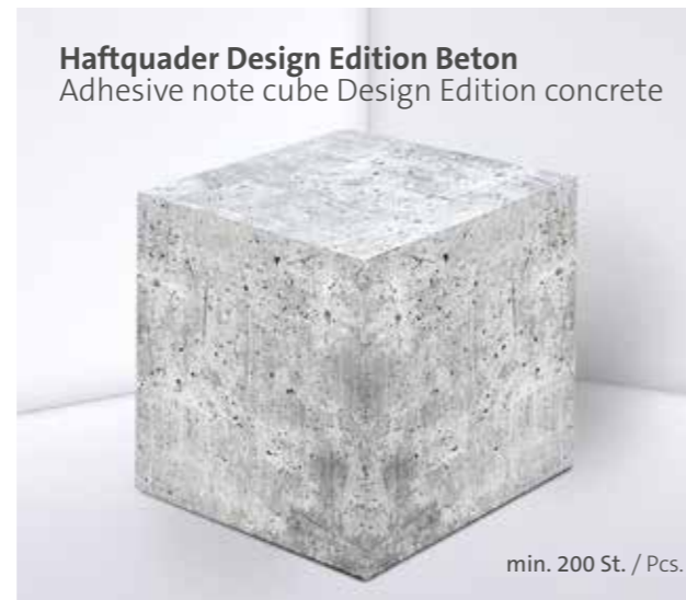
Haftquader Design Edition Beton Adhesive note cube Design Edition concrete