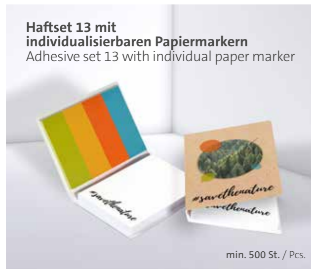
Haftset 13 mit individualisierbaren Papiermarkern Adhesive set 13 with individual paper marker