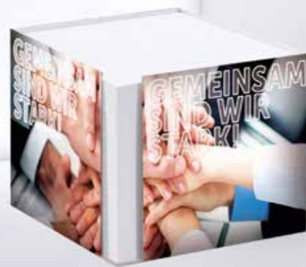
Kartonbox 07 Cardboard box 07