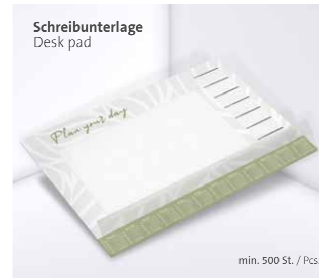
Schreibunterlage Desk pad