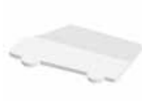
Lieferwagen Van , 94 x 52