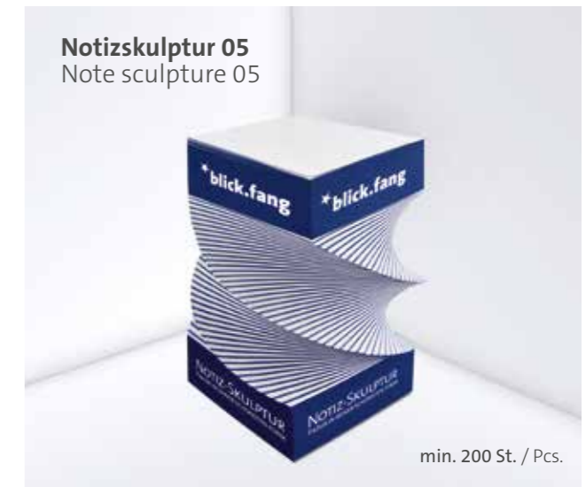
Notizskulptur 05 Note sculpture 05

Optional Einzelblattdruck 1- bis 4-farbig Offset Optional single-sheet print 1- up to 4-coloured offset