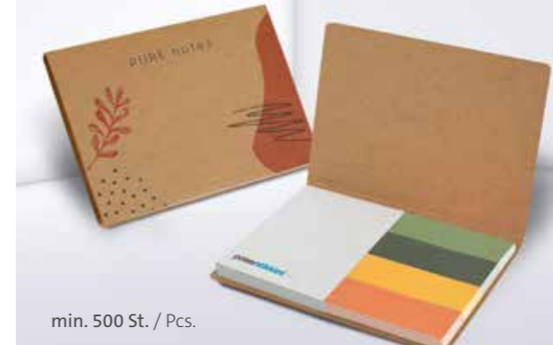
PURE notes Haftset 01 mit individualisierbaren Papiermarkern PURE notes adhesive set 01 with individual paper marker