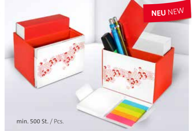
Office Organizer 03 Office organizer 03