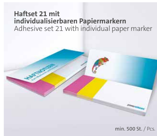
Haftset 21 mit individualisierbaren Papiermarkern Adhesive set 21 with individual paper marker

Unterstrichenes Maß = Haftseite Underlined dimension = Adhesive side