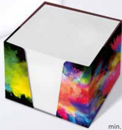
Kartonbox 01 Cardboard box 01