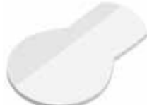
Glühbirne Light bulb , 95 x 62 mm