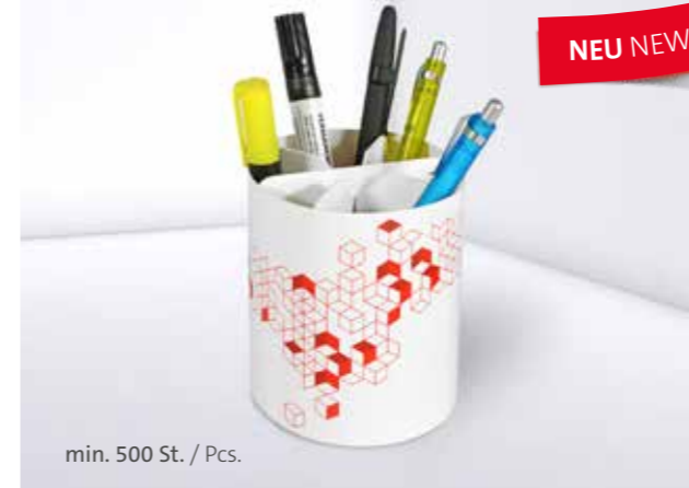
Office Organizer 05 Office organizer 05

Auch mit individualisierbarem Papiermarker set erhältlich Also available with individual paper marker set