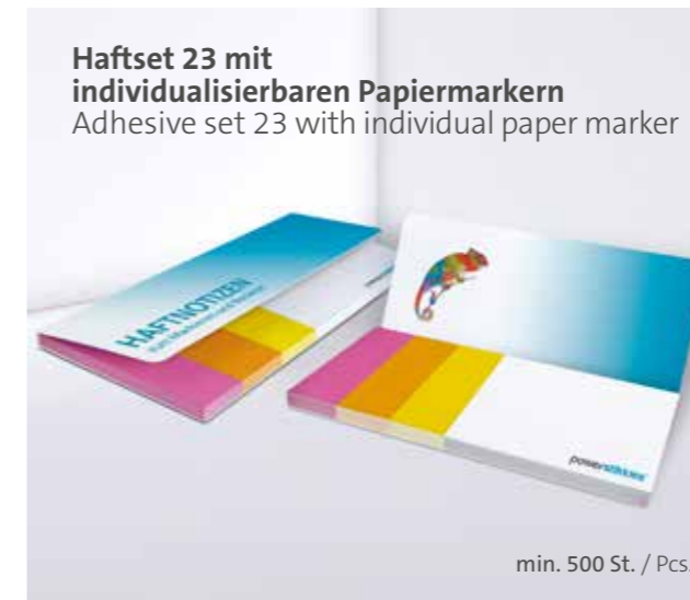
Haftset 23 mit individualisierbaren Papiermarkern Adhesive set 23 with individual paper marker