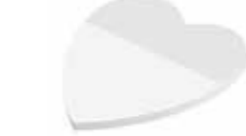
Herz Heart , 63 x 65 mm