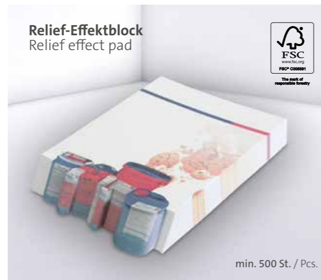
Relief-Effektblock Relief effect pad