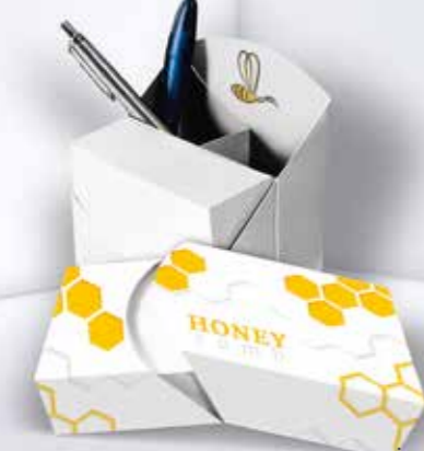
Kartonbox 08 Cardboard box 08