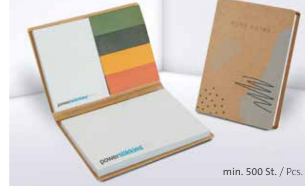
PURE notes Haftset 04 mit individualisierbaren Papiermarkern PURE notes adhesive set 04 with individual paper marker