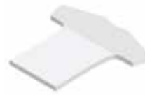
Shirt Shirt , 77 x 70 mm