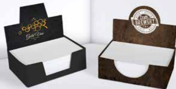
Kartonbox 09 Cardboard box 09