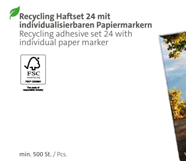
Recycling Haftset 24 mit individualisierbaren Papiermarkern Recycling adhesive set 24 with individual paper marker