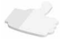
Daumen Thumb , 72 x 67 mm