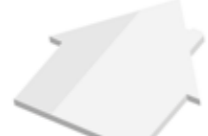
Haus House , 75 x 69 mm