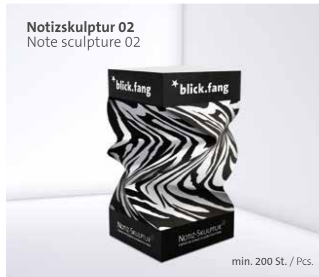
Notizskulptur 02 Note sculpture 02

Optional Einzelblattdruck 1- bis 4-farbig Offset Optional single-sheet print 1- up to 4-coloured offset