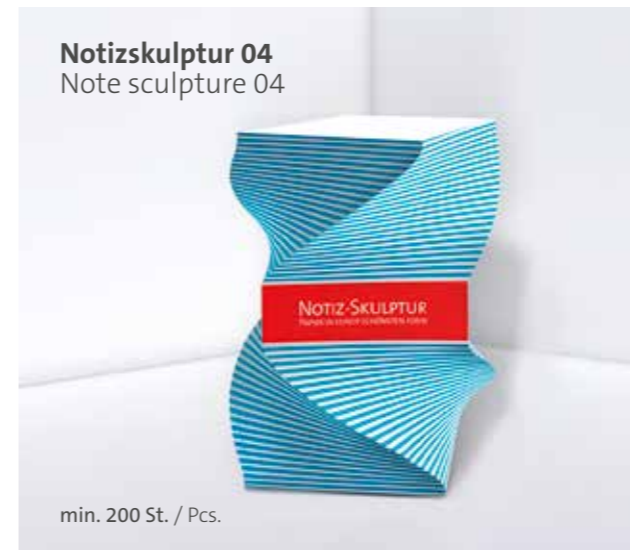
Notizskulptur 04 Note sculpture 04

Optional Einzelblattdruck 1- bis 4-farbig Offset Optional single-sheet print 1- up to 4-coloured offset