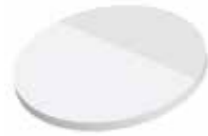
Kreis Circle , 63 x 63 mm