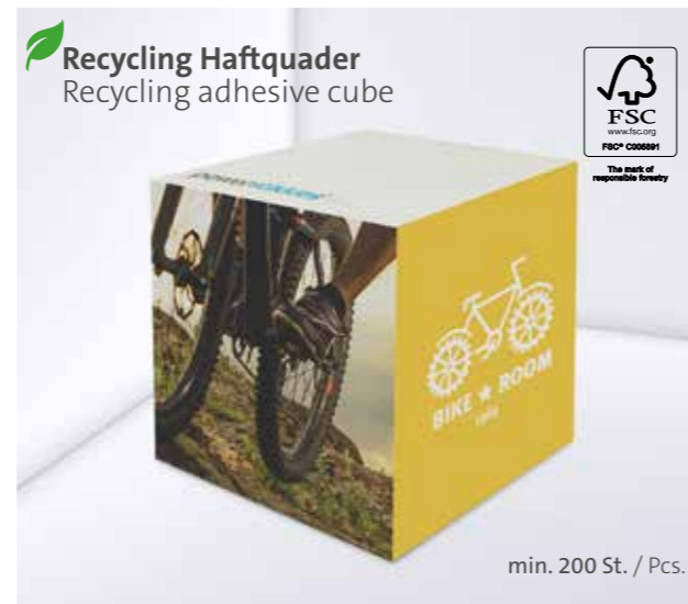
Recycling Haftquader Recycling adhesive cube