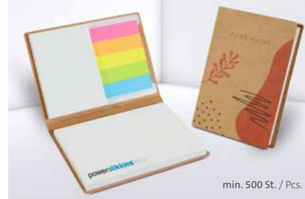
PURE notes Haftset 04 mit Papiermarker PURE notes adhesive set 04 with paper marker set