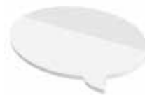
Sprechblase Speech balloon , 98 x 65 mm