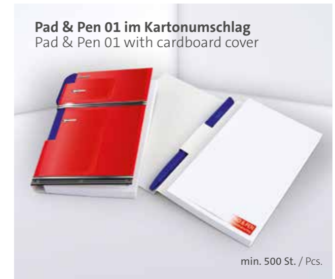
Pad & Pen 01 im Kartonumschlag Pad & Pen 01 with cardboard cover

Optional mit transparenter oder weißer Kunststoffleiste Optional with transparent or white plastic border