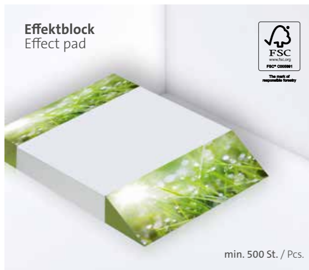
Effektblock Effect pad

Ohne Kugelschreiber, optional mit gestelltem Kugelschreiber erhältlich Without ballpoint pen, optionally available with a posed ballpoint pen