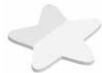
Stern Star , 70 x 70 mm