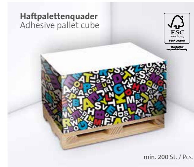
Haftpalettenquader Adhesive pallet cube