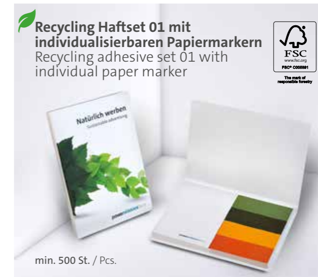
Recycling Haftset 01 mit individualisierbaren Papiermarkern Recycling adhesive set 01 with individual paper marker