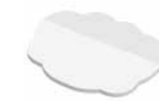
Wolke Cloud , 85,5 x 67 mm