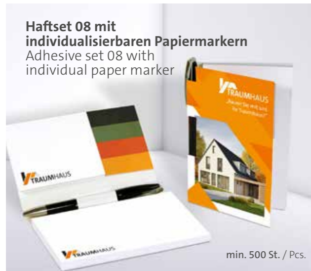
Haftset 08 mit individualisierbaren Papiermarkern Adhesive set 08 with individual paper marker